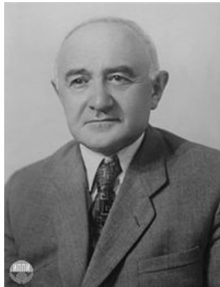
Ռուբեն Հովհաննեսի Ավանեսով

Բոգորոդիցկին հեղինակ է լեզվաբանական մի շարք տերմինների, որոնք վերաբերում են տարժամանակյա (դիախրոնիկ) ձևաբանությանը և օգտագործվում են առ այսօր: Օրինակ, նա ներմուծել է переразложение (ձևույթների սահմանների շարժ` բառի կազմում), опрощение (բառի ձևաբանական կառուցվածքի փոփոխություն) եզրույթները: