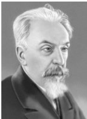
Լև Վլադիմիրովիչ Շչերբա ռուս և խորհրդային լեզվաբան (1880-1944)